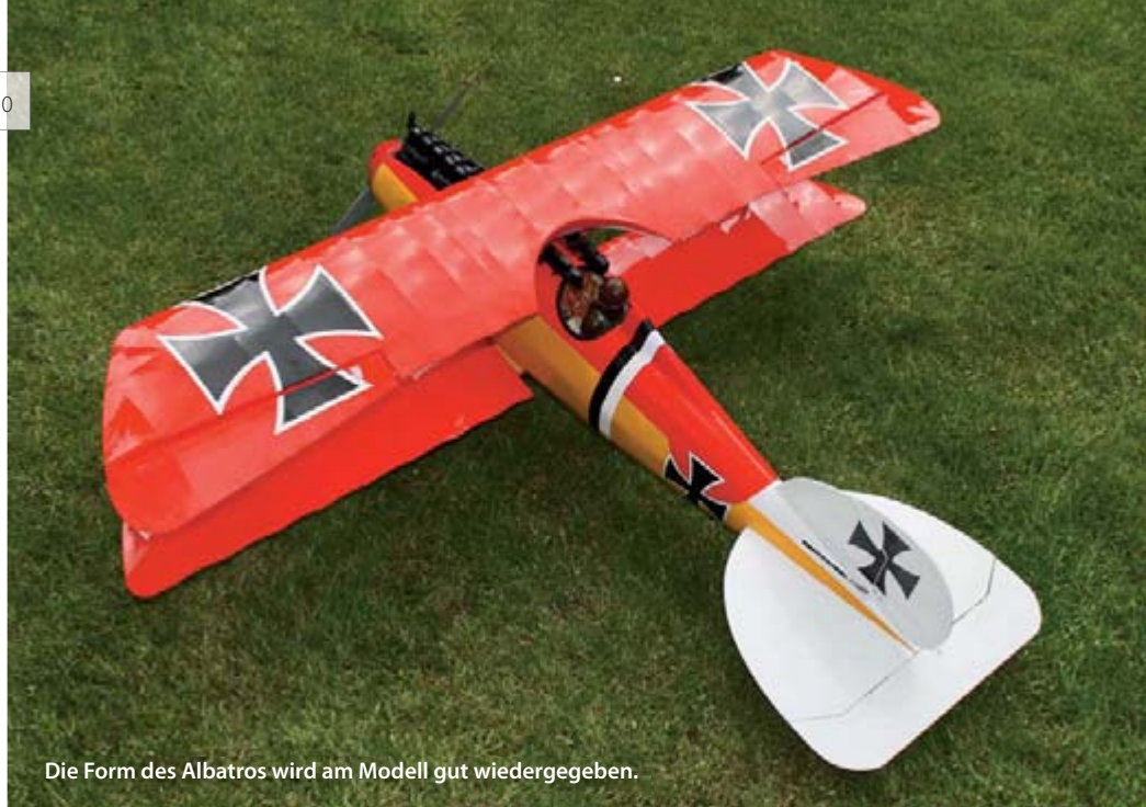
Die Form des Albatros wird am Modell gut wiedergegeben.

konnte. Also Anschraubklötze abtrennen und richtig positioniert – gleich für die größeren Servos – wieder angeklebt. Die Ruderklappen müssen noch über Fließ-Scharniere angeschlagen und die Ruderhörner montiert werden. Die CFK-Schubstangen für Seite und Höhe sind schon so genau abgelängt, dass zur Feineinstellung das Verdrehen der Gabelköpfe ausreicht.