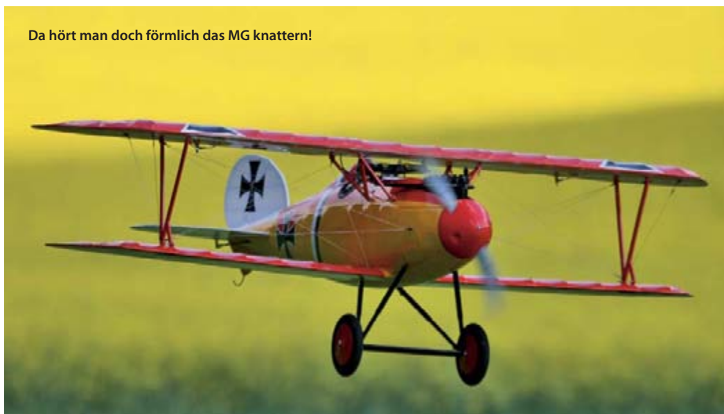
Da hört man doch förmlich das MG knattern!

Zur Motorisierung wird der haus-eigene Spitz 25 an einem LiPo mit 3-4S/2.200 mAh empfohlen. Nach Katalogangaben wiegt dieser Motor 104 g, als Spannungsquelle werden 8 bis 12 NiCd-Zellen genannt, was also 3-4 LiPo-Zellen entspräche. Daraus soll dann eine Leistung von 280 W entspringen. Bei einem Fluggewicht von 1.260 g (Herstellerangabe) wäre dies sicher ein adäquater Antrieb. Tatsache aber ist, dass das Modell leer ohne Antrieb und RC-Anlage bereits knappe 1.300 g wiegt und hier offensichtlich im Katalog der Fehlerleutefel zugeschlagen hat. Addiert man nun das Gewicht der Ausrüstung hinzu, ergibt sich ein Fluggewicht von ca. 1.750 g ohne der Berücksichtigung von Trimblei, denn aufgrund der kurzen Rumpfschnauze sind da noch einmal ca. 150 g Blei notwendig. Und mit dem sich jetzt einstellenden Fluggewicht dürfte das empfohlene Motörchen ziemlich überfordert sein.